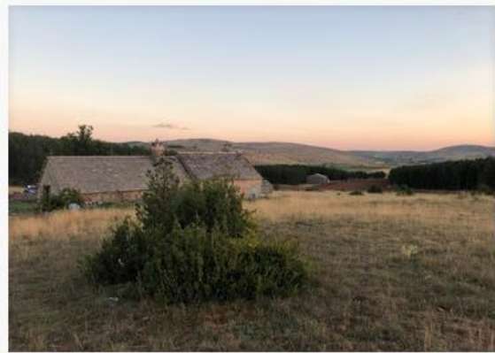
70KM - TRAIL DES STEPPES

Départ des 2 courses en même temps, samedi à 5 heures, heure matinale afin d'éviter l'absence d'ombre sur le plateau du Causse Méjean.