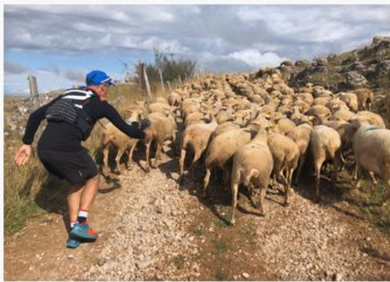
160KM - ZINZIN ULTRA-TRAIL