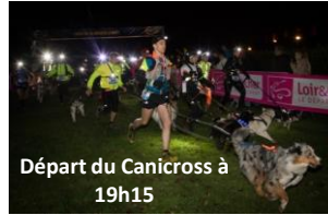
Départ du Canicross à 19h15