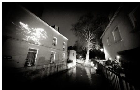
Vendôme By Night sur la dernière boucle optionnelle