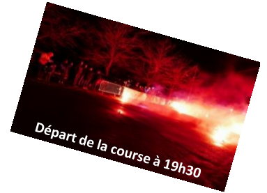
Départ de la course à 19h30

25 km minimum et 41 km maxi avec les boucles optionnelles