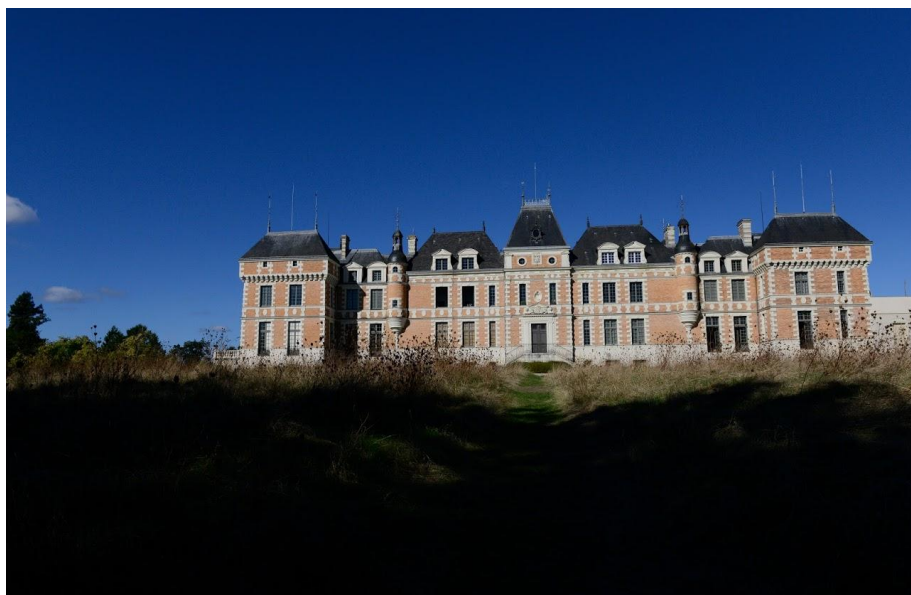
Château de Clermont

J'ai profité de la présence du Hoka test tour pour essayer les Speedgoat que je convoitais depuis un moment ;-).