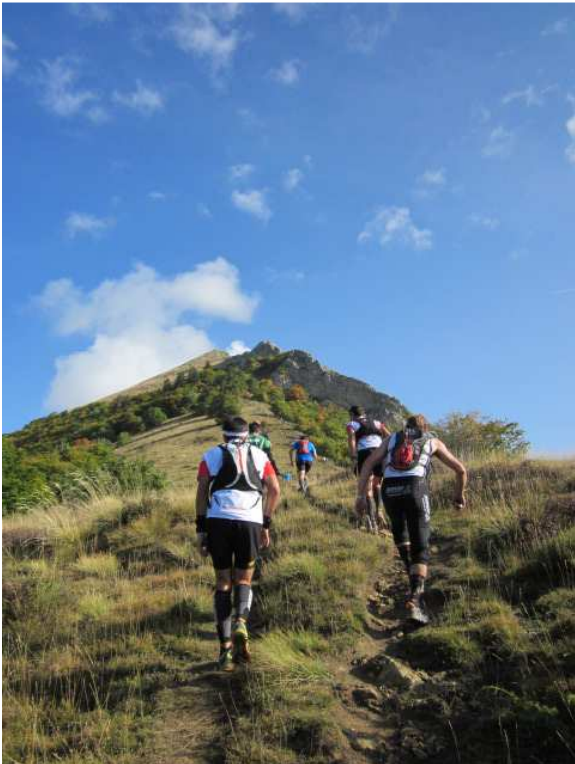
Pleins de surprises m'attendent...