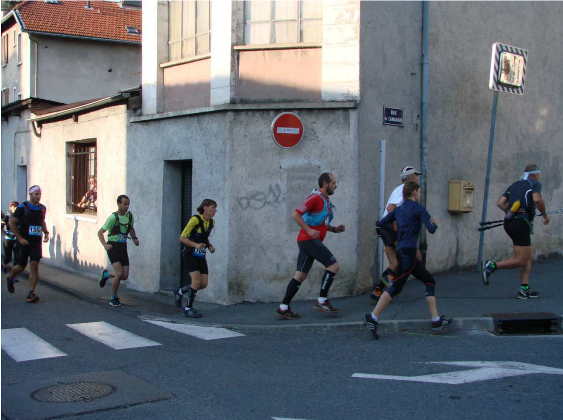
Tout le monde est arrivé, le départ de la course a été lancé !